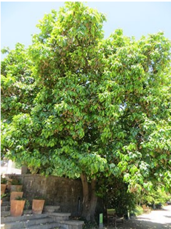
Fitxa 31: Alvocater dels Jardins de Miramar

Tant interessants com les 100 fitxes, són la colla d'annexos, com ara: glossari de termes botànics, una mica d'història del jardí on hi ha algun arbre vell, els 146 arbres declarats d'interès local per l'Ajuntament de Barcelona, els 51 arbres de més de 3 m de volt de canó (a 1,30 m de terra), 335 plantes o arbres que es poden trobar a la ciutat, recull de fotos de diferents models de rètols identificadors d'arbres, 7 rutes per veure arbres vells i els índexs de noms científics i noms catalans.