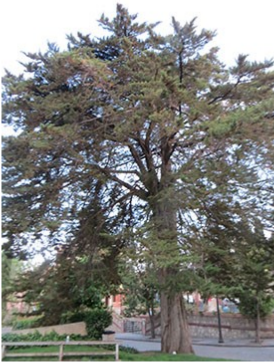
Fitxa 10: Xiprer de Lambert del Tanatori de les Corts

Cada exemplar d'arbre té una làmina amb 7 fotos per tal que es pugui identificar clarament: tronc, capçada, fulles, flors, fruits, escorça, gales, punxes o comparació de fulles d'arbres semblants. Correspon a un total de 721 imatges.